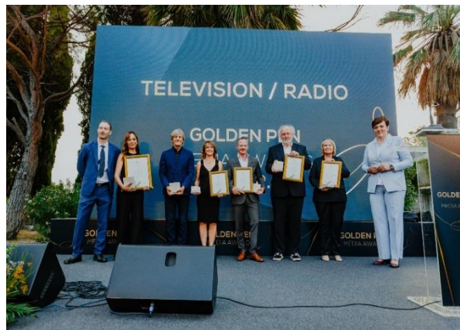
Autor: Damira Kalajžić